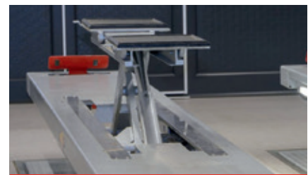
Levage auxiliaire intégré