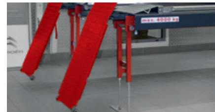
Supports pour la géométrie